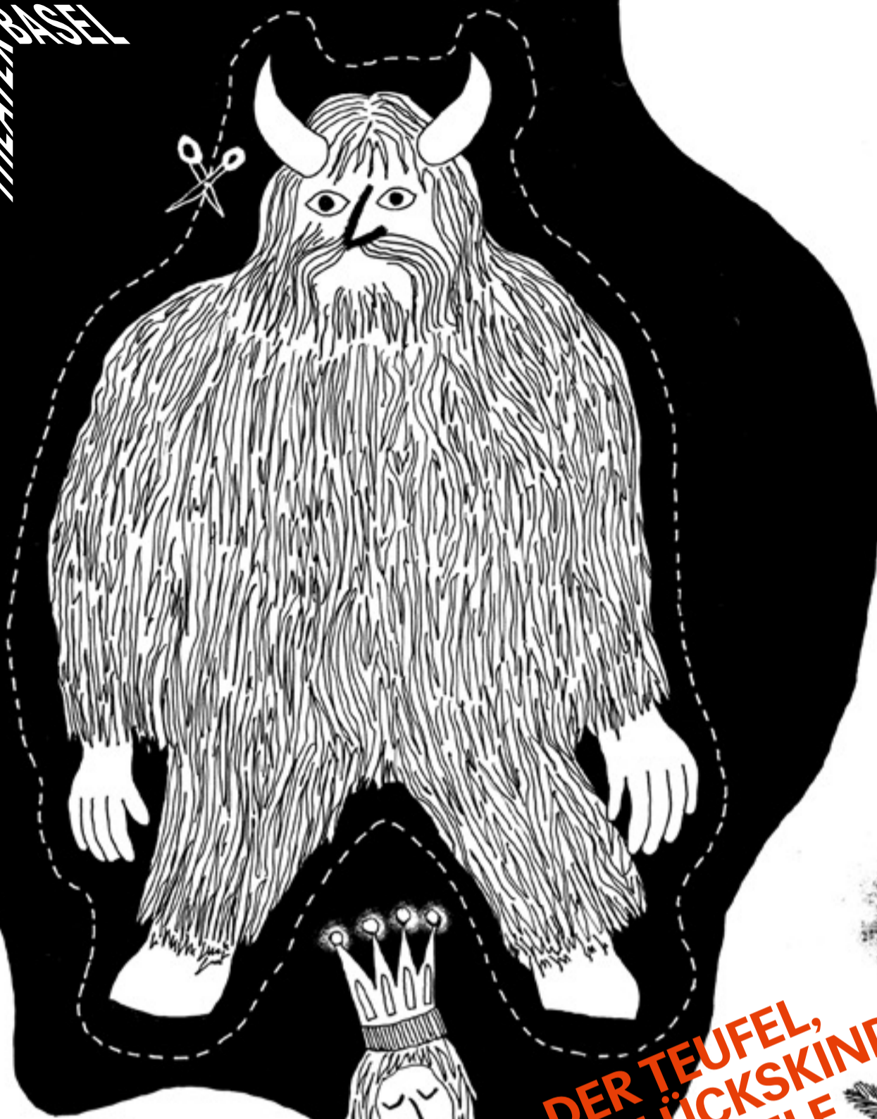
Illustration: Andreas Spörrli